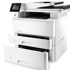
Imprimante multifonction HP LaserJet Pro M426fdw avec bac de 550 feuilles en option