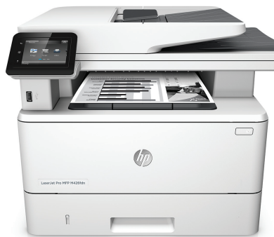
Imprimante multifonction HP LaserJet Pro M426fdn

Des performances d'impression, de numérisation, de copie et de télécopie plus rapides et plus robustes et une sécurité complète adaptée à votre façon de travailler. Cette imprimante multifonction accomplit vos principales tâches plus rapidement et protège efficacement contre les menaces. 1 Les toners avec JetIntelligence conçus par HP permettent d'imprimer plus de pages. 2